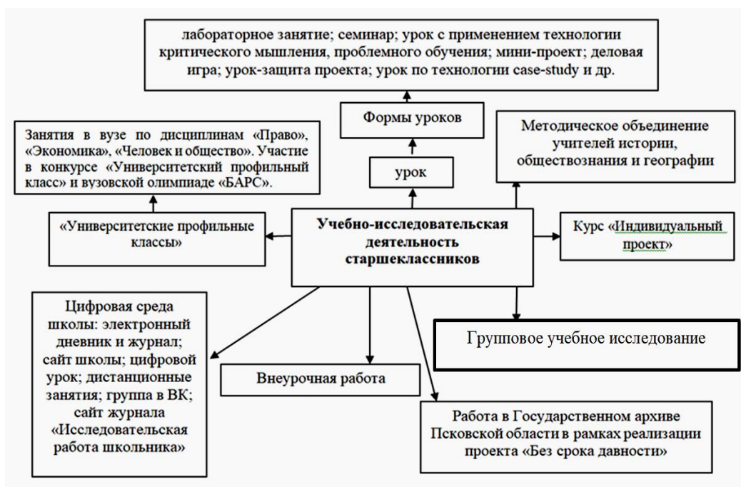
Схема 1 – Формы организации учебно-исследовательской деятельности направленные на формирование социальной картины мира

В главе 2 «Экспериментальная проверка и описание условий внедрения модели формирования социальной картины мира у старшеклассников в процессе учебно-исследовательской деятельности» описана организация и методика проведения констатирующего и формирующего экспериментов, представлены полученные данные и результаты их анализа.